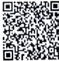
श्रम संसार Mobile APP