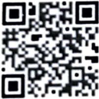
श्रम संसार वेबसाइट

श्रम संसार प्रणालीमा आवद्ध हुन श्रम संसारको वेबसाइट: shramsansar.gov.np वा मोबाइलमा Play store/App store मार्फत डाउनलोड गर्न सकिनेछ। थप जानकारीका लागि यस नगरपालिकाको रोजगार सेवा केन्द्रमा सम्पर्क गर्न सकिनेछ।